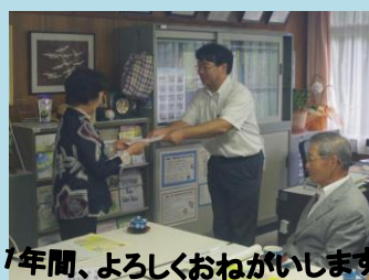
1年間、よろしくおねがいます。